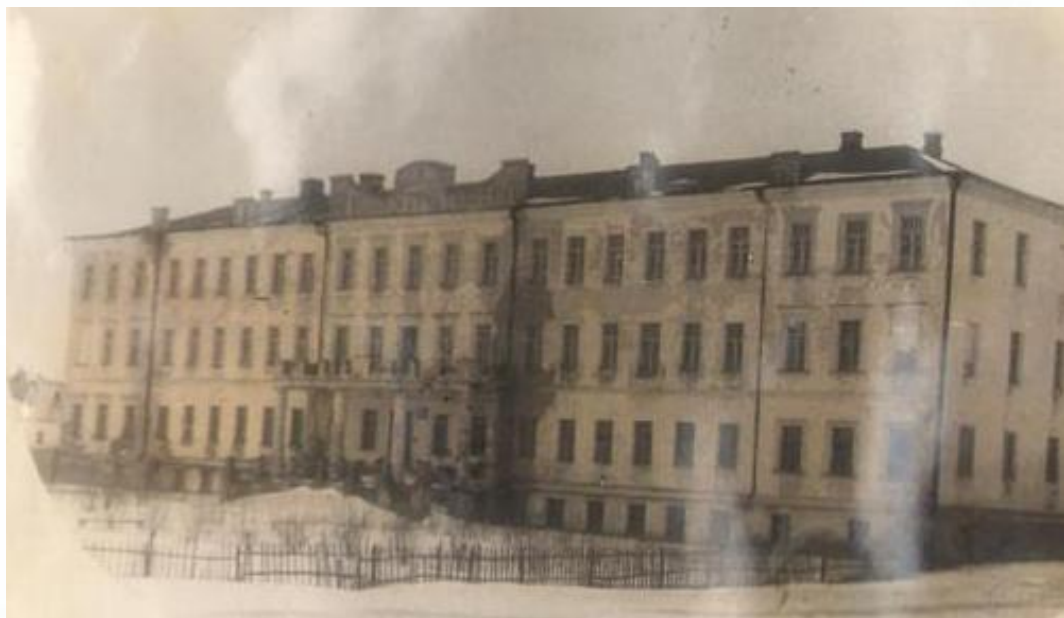
Здание до ремонта, 1948 год

Трудно было восстановить разрушенное во время войны здание, отведенное под техникум, преобразовать для занятий аудитории, помещенья для жилья студентов и преподавателей.