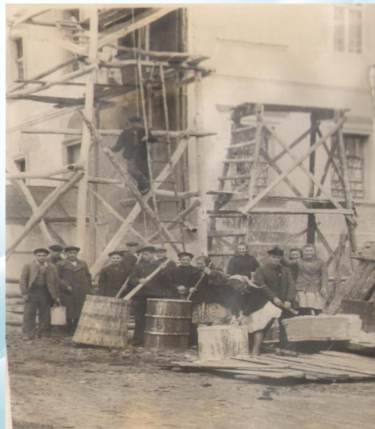
Ремонтные работы руками студентов